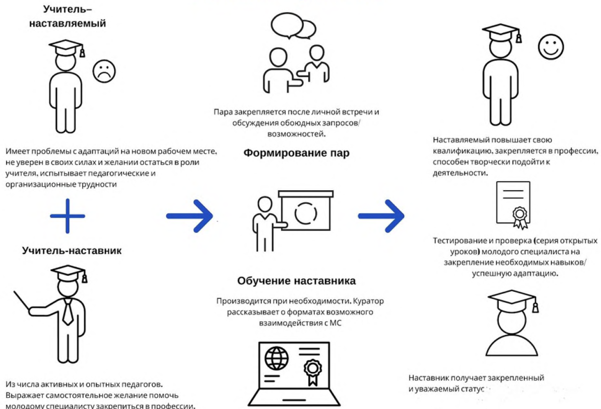
Рисунок 2. Графическое представление взаимодействия по форме «учитель – учитель»