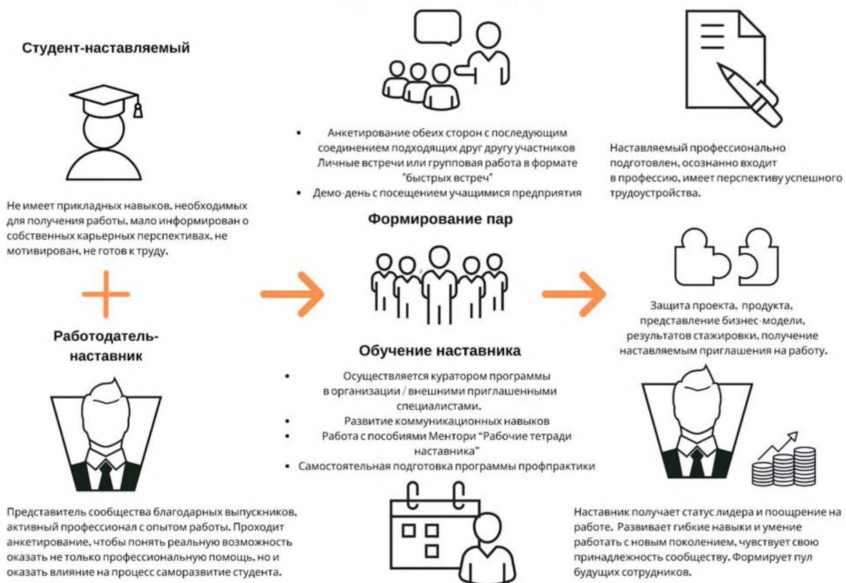
Рисунок 5. Графическое представление наставнического взаимодействия по форме «работодатель – студент»