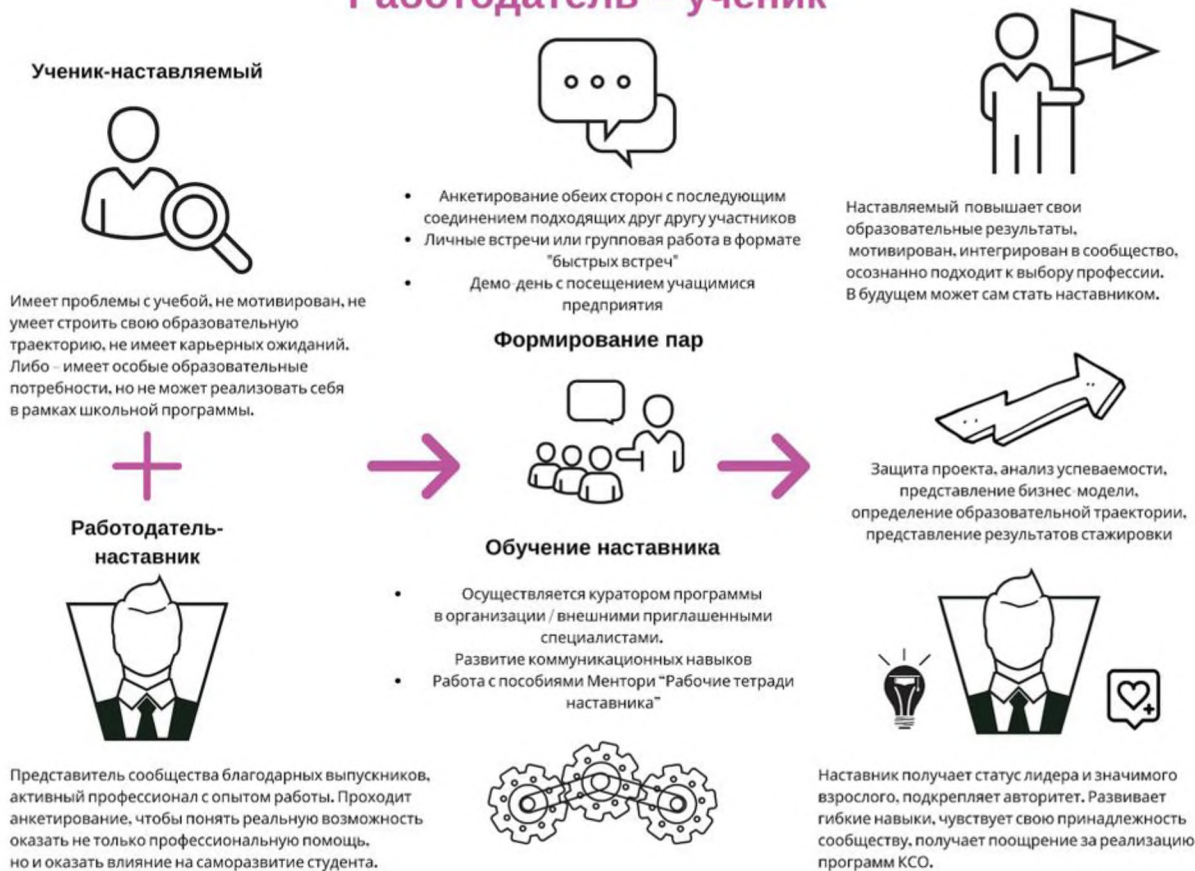
Рисунок 4. Графическое представление наставнического взаимодействия по форме «работодатель – ученик»