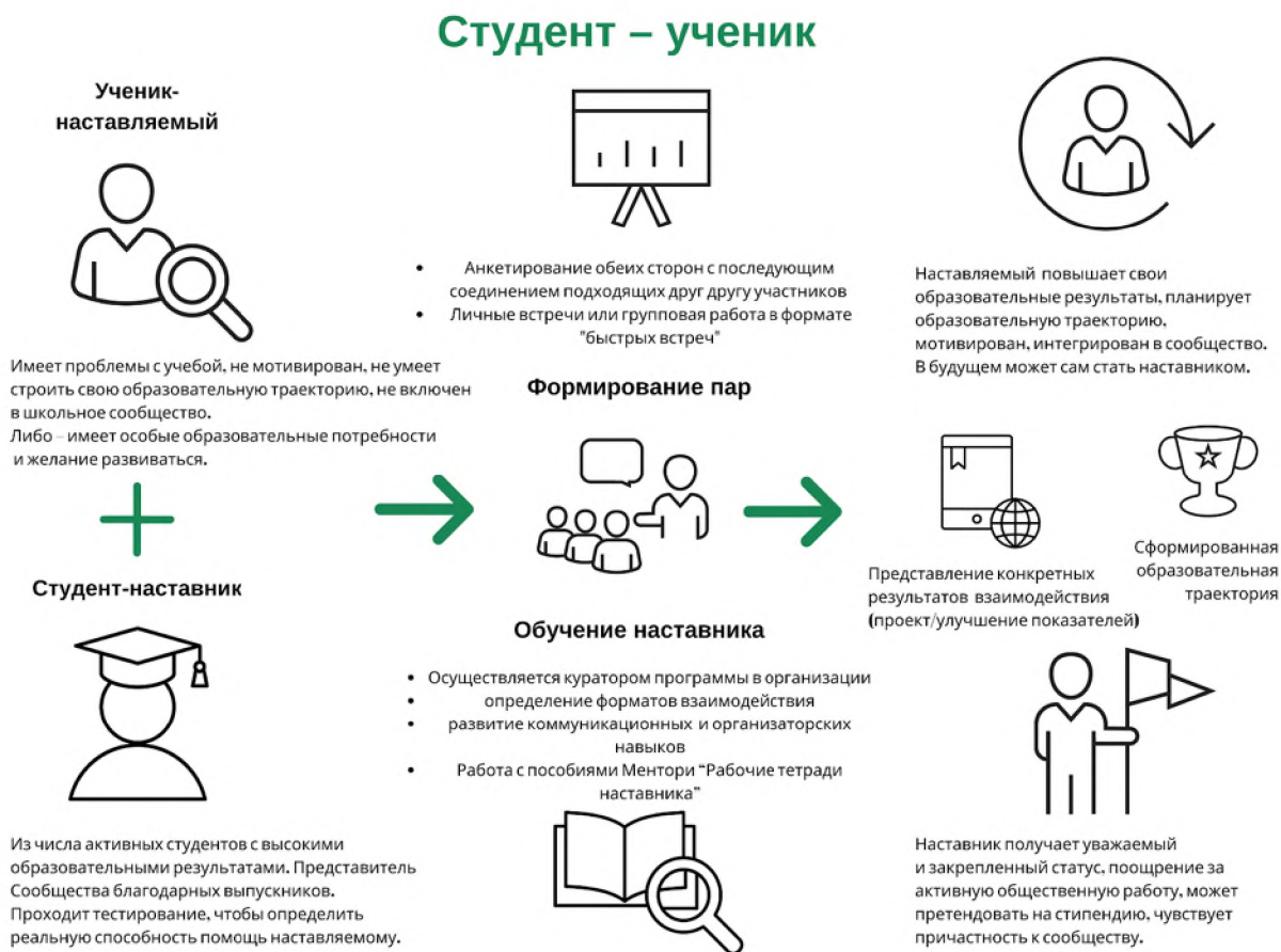
Рисунок 3. Графическое представление наставнического взаимодействия по форме «студент – ученик»